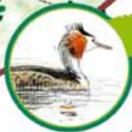
LE GREBE HUPPE

En avril, ne manquez surtout pas les danses amoureuses et les offrandes que se font les couples de Grèbes. Plus tard ils promèneront leurs jolis poussins sur le dos.