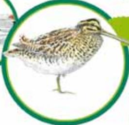
LA BECASSINE DES MARAIS

Petite et discrète bien que très jolie. La Becassine se nourrit dans les prairies détrempées en hiver et au début du printemps.