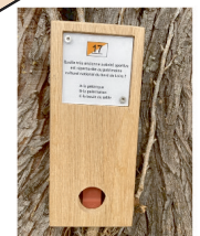
balise à trouver