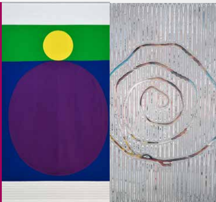
A gauche : Seulgi Lee, U : En pleine mer, une tortue aveugle tombe sur une planche trouée pour y glisser la tête afin de respirer. = Un fait rarissime, 2017, Seulgi Lee. A droite : Julien Rodriguez, Sans titre (014), 2019