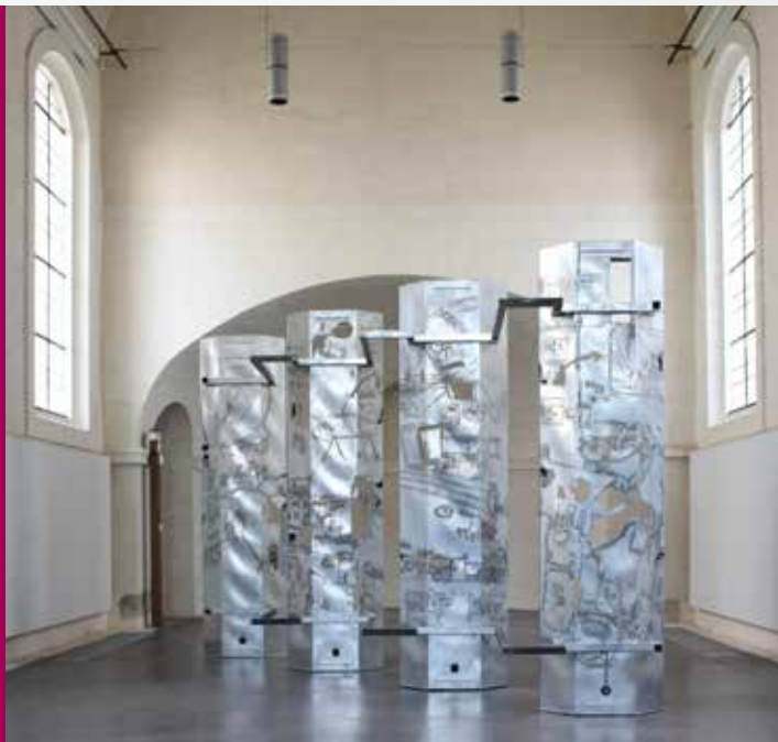
Nicolas Tubéry, Élevage, Céréales, GAEC et Machinisme - Stori borde, 2020, Acier galvanisé ; 300 x 425 cm. Production Le MAT