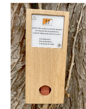
balise à trouver