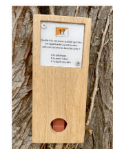
balise à trouver