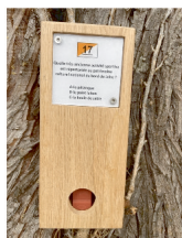
Balise à trouver