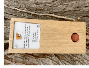
Balise à trouver