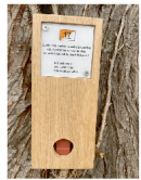
Balise à trouver